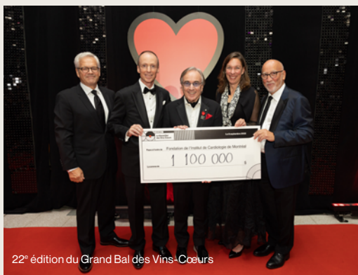
22 e édition du Grand Bal des Vins-Cœurs